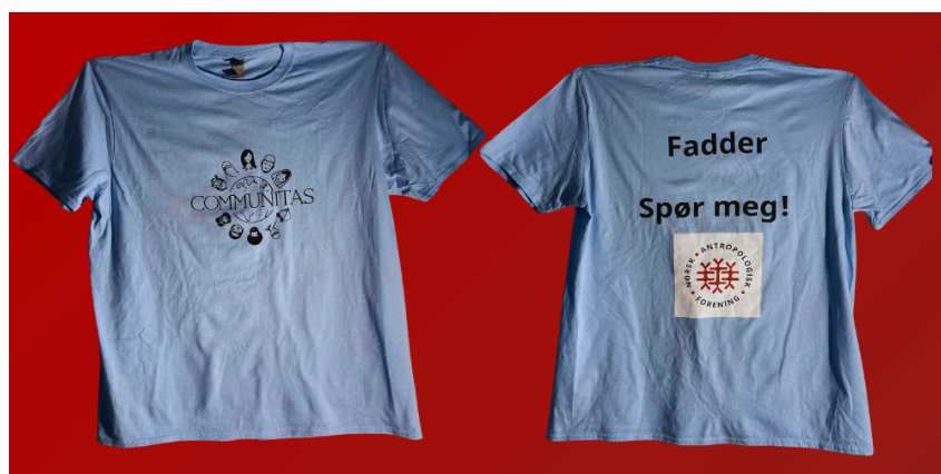
Faddertrøyene til Communitas linjeforening

Studenttidsskriftet i Bergen, Kula Kula, har nå blitt gitt muligheten til å nominere tekster til Norsk antropologisk tidsskrift (NAT). Dette blir en videreføring av ordningen som tidligere var med studenttidsskriftet Betwixt & Between. Betwixt & Between er ikke aktiv lenger, dermed kan artikler fra Kula Kula gis anledning til å bli publisert i NAT som “årets artikkel fra studenttidsskrift” - etter ordinære peer review-prosesser. Vi ser frem til samarbeidet!